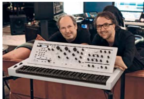
Hollywood-Komponist Hans Zimmer (links) freut sich über den schwäbischen Synthesizer.