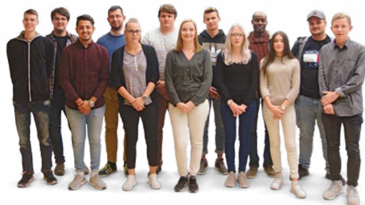
Los geht's Richtung Arbeitsleben: die neuen Azubis am Noerpel-Hauptsitz in Ulm.

I m September 2017 haben 56 Schulabgänger ihre Ausbildung bei Noerpel begonnen, darunter zwei Flüchtlinge aus Afghanistan und Nigeria. Vier weitere junge Menschen starten ein duales Studium. Insgesamt bildet Noerpel zurzeit 138 Frauen und Männer in neun verschiedenen Berufen und dualen Studiengängen aus. Besonders beliebt ist bei den Azubis die Ausbildung zur Kauffrau oder zum Kaufmann für Spedition und Logistikdienstleistung. Ebenfalls begehrt sind die dualen Studienplätze. ●