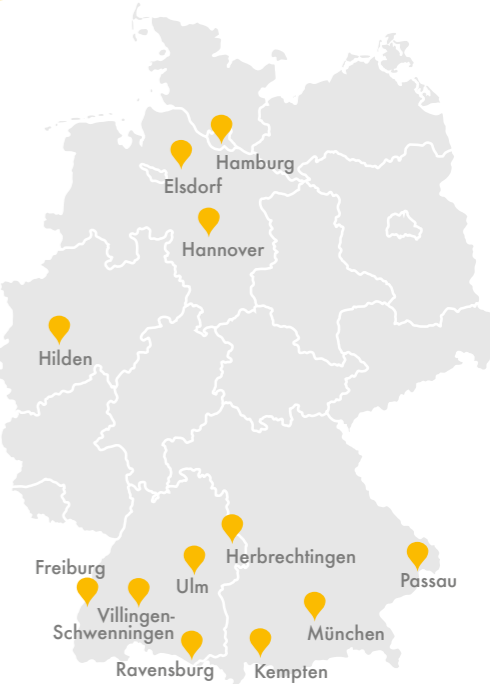
Die zwölf Logistikstandorte der Noerpel-Gruppe in Deutschland