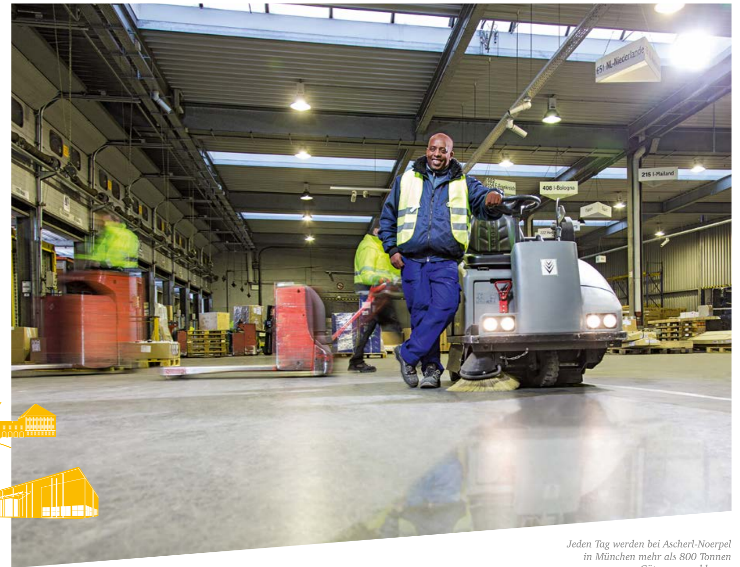
Jeden Tag werden bei Ascherl-Noerpel in München mehr als 800 Tonnen Güter umgeschlagen.